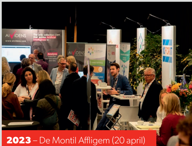
2023 – De Montil Affligem (20 april)