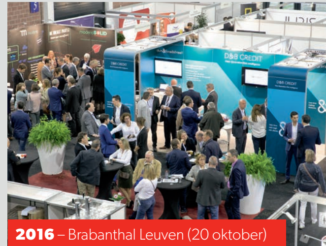
2016 – Brabant Leuven (20 oktober)