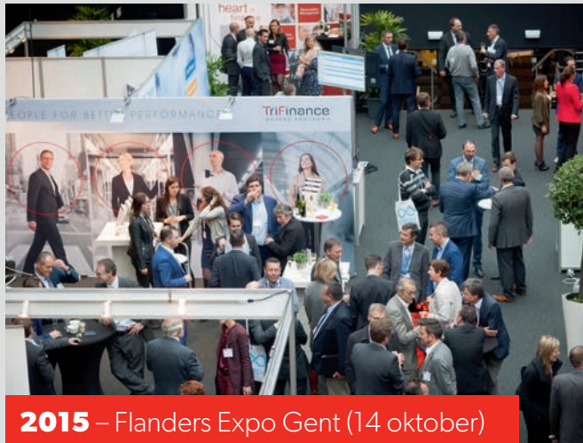
2015 – Flanders Expo Gent (14 oktober)

2015 - 2016 - 2017 - 2018 - 2019 - 2022 - 2023 - 2024 - 2025