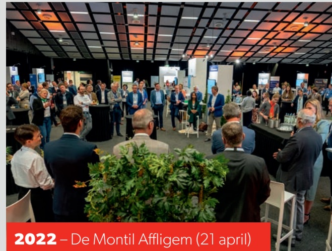
2022 – De Montil Affligem (21 april)