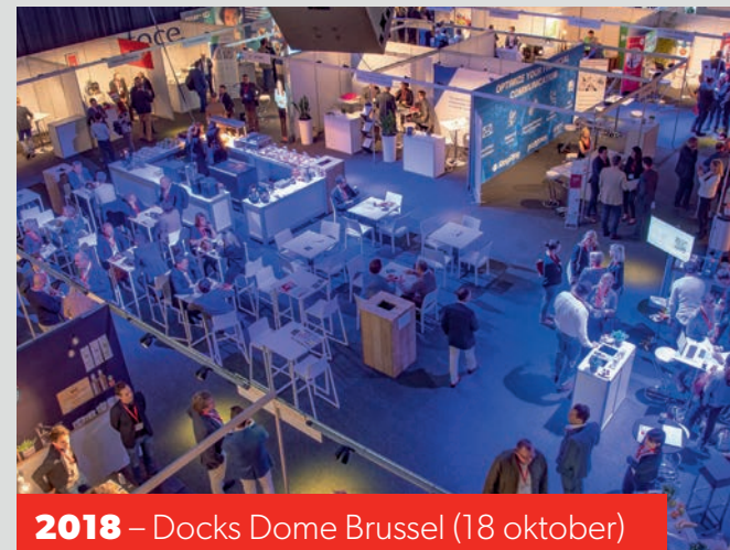
2018 – Docks Dome Brussel (18 oktober)