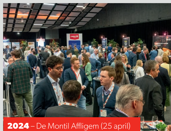
2024 – De Montil Affligem (25 april)