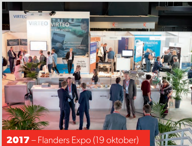
2017 – Flanders Expo (19 oktober)